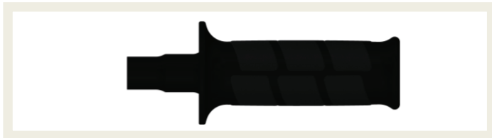
Code: DH ANr. 58011