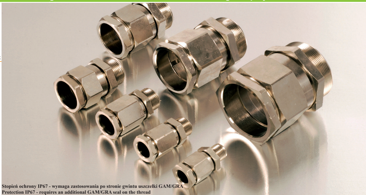
Stopień ochrony IP67 - wymaga zastosowania po stronie gwintu uszczelki GAM/GRA Protection IP67 - requires an additional GAM/GRA seal on the thread